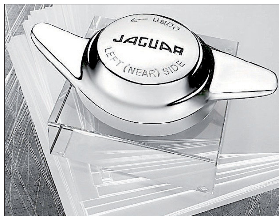
ALGÚNS DOS PRODUTOS EXCLUSIVOS QUE SE PODEN ATOPAR NA WEB PASIONLUJO.COM