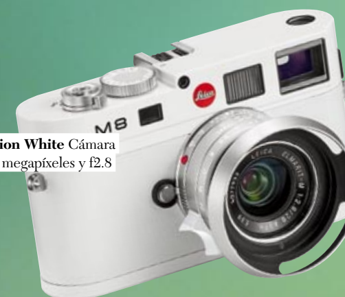
LEICA M8 Special Edition White Cámara telemétrica digital de 10,3 megapíxeles y f2.8 ASPH. c.p.v. €