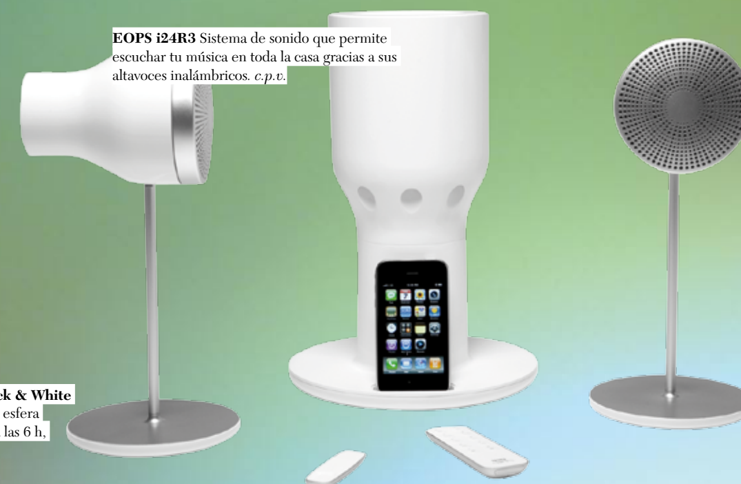
EOPS i24R3 Sistema de sonido que permite escuchar tu música en toda la casa gracias a sus altavoces inalámbricos. c.p.v.