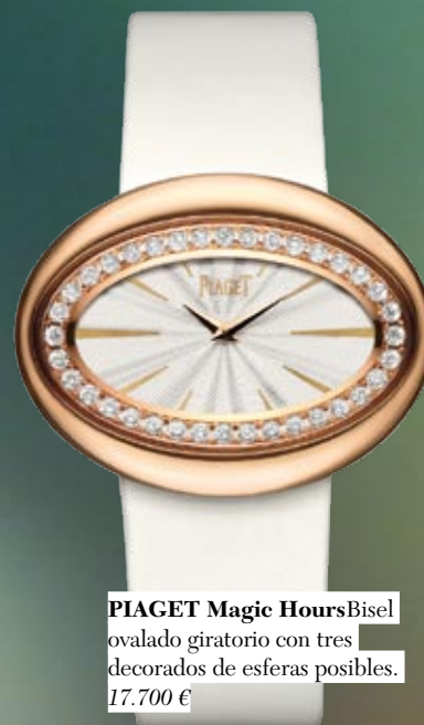
PIAGET Magic Hours Bisel ovalado giratorio con tres decorados de esferas posibles. 17.700 €