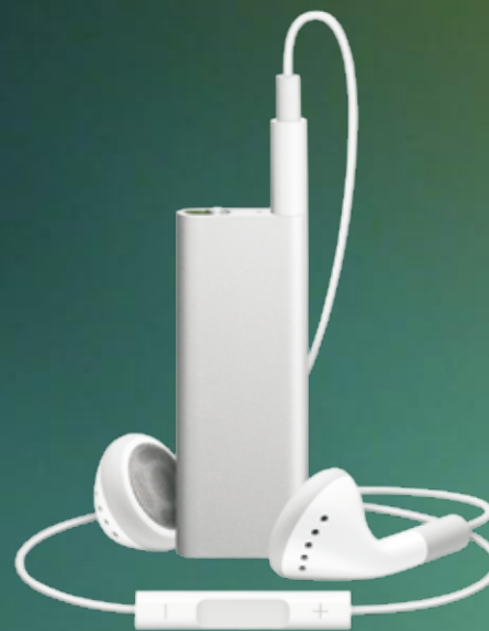
APPLE iPod Shuffle Con 4 Gb (1000 canciones) y novedosa función VoiceOver que permite controlar la música del reproductor con la ayuda de una voz inteligente. Auriculares con nuevo botón multifunción. 75 €