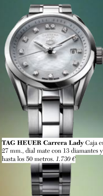
TAG HEUER Carrera Lady Caja en acero de 27 mm., dial mate con 13 diamantes y hermético hasta los 50 metros. 1.730 €