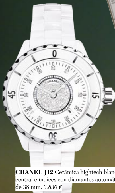
CHANEL J12 Cerámica hightech blanca, esfera central e índices con diamantes automático con caja de 38 mm. 3.830 €

"El tiempo es el mejor autor: siempre encuentra un final perfecto" Charles Chaplin