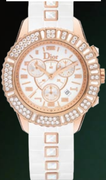
DIOR Christal Caja de 38 mm. en oro rosa, inserciones de diamantes y cristales blancos de zafiro. 15.000 €