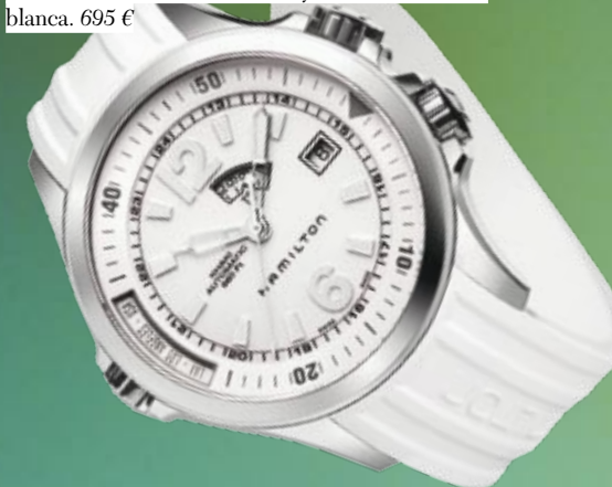
HAMILTON Khaki Navy GMT Caja de acero inoxidable de 42 mm., movimiento automático, función GMT, cristal de zafiro y correa de caucho blanca. 695 €