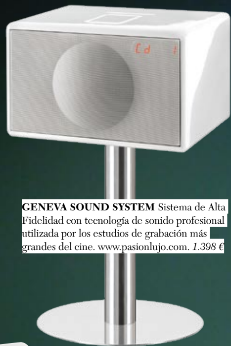
GENEVA SOUND SYSTEM Sistema de Alta Fidelidad con tecnología de sonido profesional utilizada por los estudios de grabación más grandes del cine. www.pasionlujo.com. 1.398 €