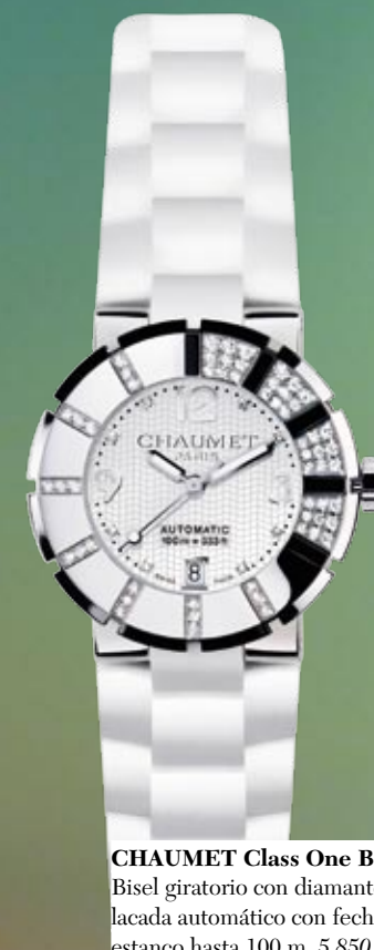
CHAUMET Class One Black & White Bisel giratorio con diamantes, esfera lacada automático con fecha a las 6 h, estanco hasta 100 m. 5.850 €