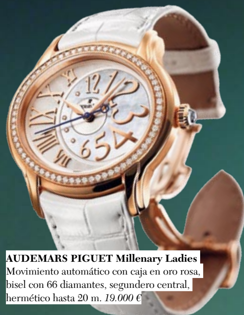
AUDEMARS PIGUET Millenary Ladies Movimiento automático con caja en oro rosa, bisel con 66 diamantes, segundero central, hermético hasta 20 m. 19.000 €