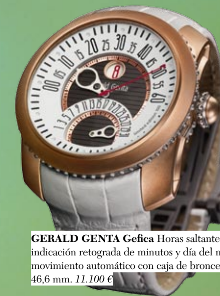
GERALD GENTA Gefica Horas saltantes e indicación retrograda de minutos y día del mes, movimiento automático con caja de bronce de 46,6 mm. 11.100 €