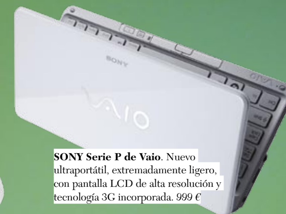
SONY Serie P de Vaio. Nuevo ultrapotátil, extremadamente ligero, con pantalla LCD de alta resolución y tecnología 3G incorporada. 999 €