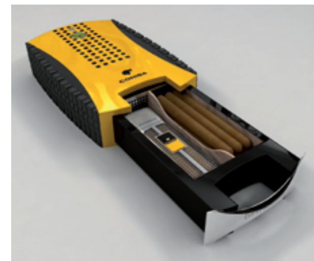
Arriba, la Cava de puros Philip Guy. Bajo estas líneas, el humidor Cohiba Car Edition. Abajo, un cenicero de la firma Hoyo de Monterrey.

Club Pasión Habanos, www.clubpasionhabanos.com ; Pasión Lujo, www.pasionlujo.com